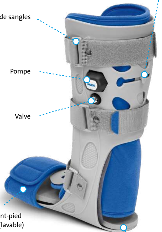
Semelle intérieure amovible