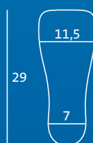
L 43,5–45 Semelle intérieure et protège-orteils = ML