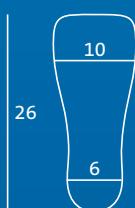
S 39–41 Semelle intérieure et protège-orteils = MS