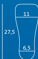
M 41,5–43 Semelle intérieure et protège-orteils = MM