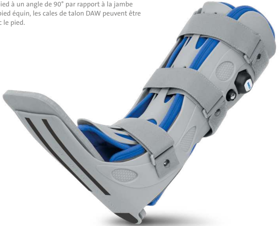
Attelle de mollet avec doublure de mollet (lavable)