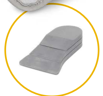
Relief Insert® 2.0 Attelle de positionnement