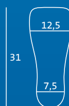
XL 45,5–47 Semelle intérieure et protège-orteils = MXL

Toutes les mesures sont définies en cm et correspondent à la semelle intérieure. Les tailles de chaussures DARCO ne représentent qu'une référence générale. Le choix de la pointure est fortement influencé par le volume des bandages et la taille du plâtre.