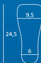
XS 37–38,5 Semelle intérieure et protège-orteils = WM