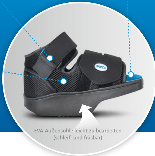
EVA-Außensohle leicht zu bearbeiten (schleif- und fräsbar)