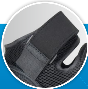
breiter Klettgurt mit medialer und lateraler Umlenkung