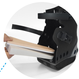
Keilförmiges Sohlensystem für eine optimale Rückfußbelastung