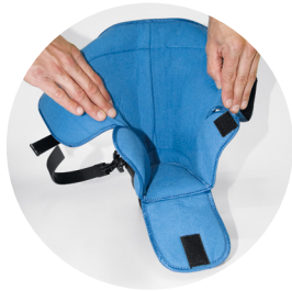
Weite Öffnung für leichtes Einsteigen

Bei der Body Armor® Pro Term Fußstumpforthese können Stumpfschwankungen in der Interimsphase mithilfe des Soft-Linings mit integrierter Pumpe schnell ausgeglichen werden. Die Fußstumpforthese ermöglicht so eine individuelle Anpassung an die Gegebenheiten des Fußstumpfes. Der knöchelübergreifende Schaft in 90° Stellung stabilisiert das obere sowie untere Sprunggelenk. Die ventrale Stützlasche und das variable wie auch sichere Verschluss-System ermöglichen eine zirkuläre, flächige Kompression. Die keilförmige Lauf- und Innensohle in Dorsalextension gewährleistet zudem eine optimale Rückfußbelastung.